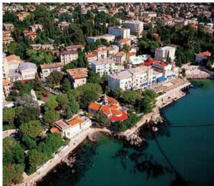
Hotel Kvarner - Opatija