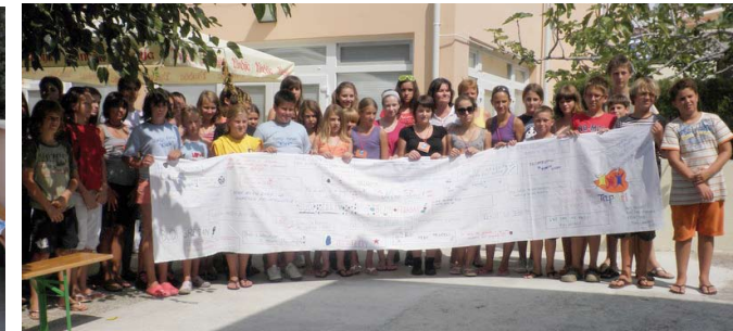
Dječji forumaši iz DND-a Opatija na Susretima DF-a Hrvatske na Rabu, 2009. godine