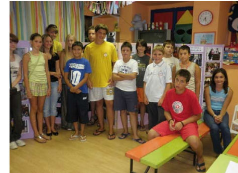
Vijećnici VI saziva DGV-a na radionicama