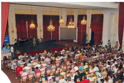
publika Veliki mali za Opatiju, Kristalna dvorana hotela Kvarner, 2009

ZAHVALJUJEMO SE SVIM SUDIONICIMA, POKROVITELJIMA I SPONZORIMA KOJI SU SVOJIM SUDJELOVANJEM OMOGUĆILI OVAJ PROJEKT.