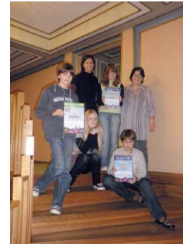
DGV-ovci na V susretima Dječjih vijećnika Hrvatske u Zagrebu