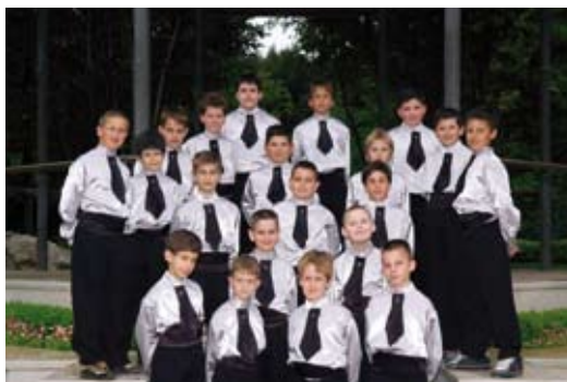
zbor „Opatijski dječaci“ / choir „Opatija boys“