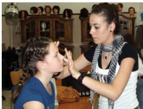
Šminkanje za Veliki i mali 2008 / Make up for Big ones and small ones 2008