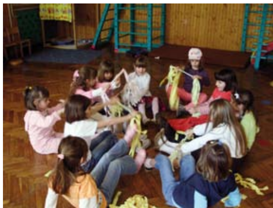
Vrtić Volosko / Kindergarten Volosko

Kinder im Vorschulalter können einen Kindergarten besuchen. In der Stadt Opatija gibt es 5 Kindergärten: Opatija, Volosko, Ičići und Veprinac, und in Lovran befindet sich der Kindergarten Lovran. Kindergarten Opatija umfasst etwa 400 Kinder, die in Gruppen arbeiten. Die Kindergärten bieten 11- Stunden und 5,5 - Stunden Programme und die Kinder werden ihrem Alter entsprechend ganzheitlich gefördert und auf das Leben in der Gemeinschaft vorbereitet. Die Kindergartenpädagoginnen bereiten einen anregungsreichen Tag vor, damit die Kinder viele Erfahrungen sammeln und Wissen erwerben können. Durch ein mannigfaltiges Angebot werden den Kindern vielseitige Möglichkeiten geboten Erfahrungen zu machen, sei es im motorischen, rhythmisch-musikalischen, sprachlichen oder kreativen Bereich. So gibt es eine Kunsterziehungsgruppe in Opatija, eine Schauspieltheatergruppe in Lovran, eine Gruppe in welcher die Kinder English oder Italienish lernen in Opatija, Lovran und Ičići und eine Sportgruppe in Volosko.