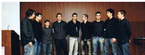
Muška klapa "GEK" / Male singing group „GEK“