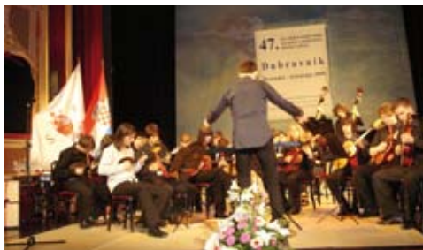
Tamburaški orkestar glazbene škole Alberta Štrige – Križevci / Tamburitza Orchestra