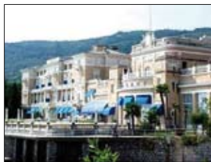
Hotel Kvarner - Opatija