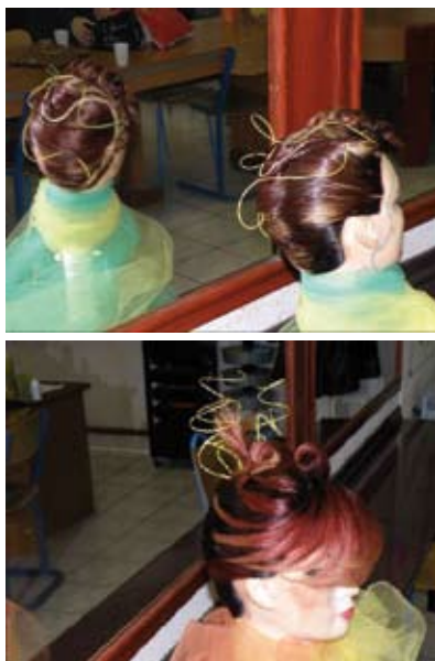
Učenički radovi na natjecanjima / Works of pupils at competitions