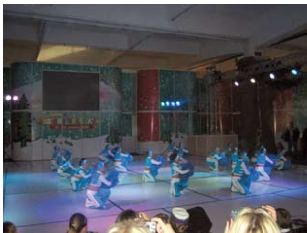
Opatijske mažoretkinje / Opatija's Majorettes