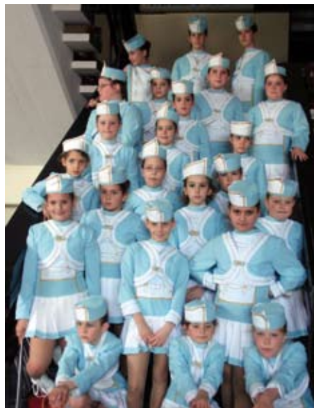
Opatijske mažoretkinje / Opatija Majorettes