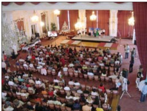
Veliki i mali za Opatiju, Kristalna dvorana hotela Kvarner, 2008 Big ones and small ones for Opatija, Hotel Kvarner, Crystal hall, 2008

ZAHVALJUJEMO SE SVIM SUDIONICIMA, POKROVITELJIMA I SPONZORIMA KOJI SU SVOJIM SUDJELOVANJEM OMOGUĆILI OVAJ PROJEKT