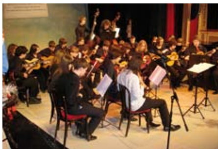
Tamburaški orkestar glazbene škole Alberta Štrige – Križevci