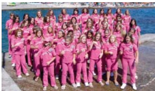
Zbor «Mići vrapčići» / choir „Little Sparrows“