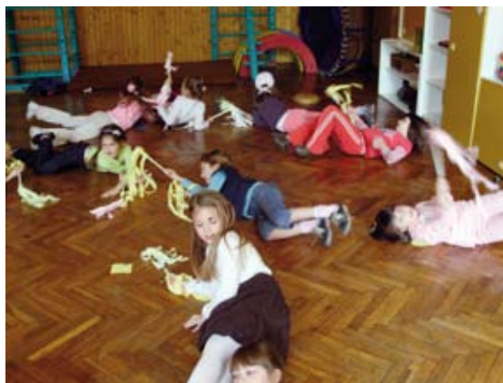
Vrtić Volosko / Kindergarten Volosko

Through organized pre-school education within different programs, this Institution comprises around 400 children aged from 1 to 6 years. On the territory of the City of Opatija, the program is organized in 4 different locations: Kindergarten Opatija, Kindergarten Volosko, Kindergarten Icici, Kindergarten Veprinac and Kindergarten Lovran. Educational activities with modern concept through which is realized an open, dynamic pedagogy process must start from general assumptions related to development of individuality which means development of an individual in accordance with personal needs, capabilities and possibilities. Most of the children from 11 or 6 hours programs is included in at least one of the organized shorter specialized programs depending on their individual interests: Artistic Workshop (painting) – Kindergartens Opatija and Lovran; Drama Workshop – Kindergarten Lovran; Drama Workshop in chakavian dialect – Kindergarten Lovran; Early Learning of Italian Language – Kindergartens Opatija, Volosko, Lovran, Icici; Early Learning of English Language – Kindergartens Opatija, Volosko, Icici; Body Activities – Kindergarten Volosko.