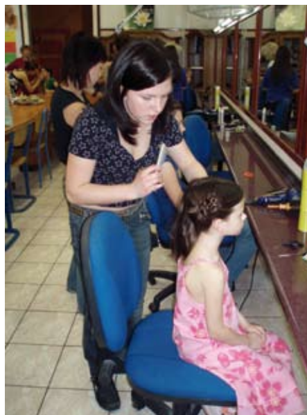
Priprema fizure za Veliki i mali 2008 / Hairstyling Big ones and small ones 2008