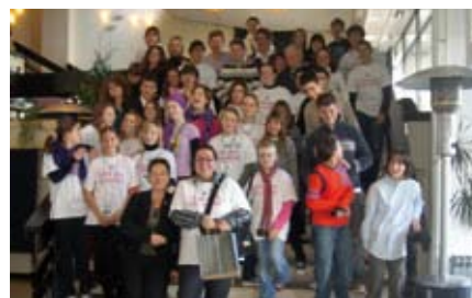
4. Susret Dječjih gradskih vijeća HR u Opatiji 2008 4th Assembly of Children's City Councils of Croatia in Opatija