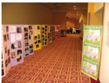
Izložba 4 Susreta Dječjih gradskih vijeća HR u Opatiji 2008 Exhibition of 4 th Children's City Councils of Croatia in Opatija