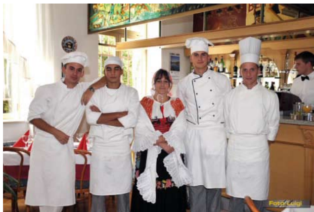
Učenici i nastavnici poznati su po mnogobrojnim projektima od kojih se ističe "Mirisi i okusi Europske unije". Ovim projektom naša škola želi, prije politike i političara, kročiti u europske integracije.

Catering School Opatija was founded in 1946 with basic activity to educate personnel in catering and tourism. The majority of the trained and quality staff in all major hotel and catering establishments in this area got their professional knowledge through our curriculum, which speaks for itself. At the moment there are 400 pupils being educated in four different programs: waiter, cook, confectioner and tourist-hotelier commercialist. The quality of the course of study as well as the pupils, who are its integral part, prove themselves in everyday work and in different national and international competitions and gastronomic gatherings. The pupils in our school, accompanied by their teachers, regularly compete in international contest of catering and tourist schools "GASTRO", achieving excellent results. Our school is the only one in Croatia that has been an overall winner for three times in a row thus winning the transitional "Tihomir Trnski" Cup in permanent ownership. Besides educating pupils, our teachers and pupils are eager to participate in various projects and programs, the most renowned is "From our granny's kitchen in modern way."