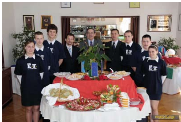
Ugostiteljska škola Opatija / Catering school

Die gastgewerbliche Fachschule in Opatija wurde im Jahre 1946 gegründet. In dieser Schule werden Berufe im Gastgewerbe und Tourismus ausgebildet. Die meisten Mitarbeiter im Tourismus, auf diesem Gebiet, haben eben diese Schule beendet. Es ist bekannt, daß sie über gutes Fachwissen, über entsprechende EDV – und Fremdsprachenkenntnisse verfügen. In der gastgewerblichen Schule in Opatija gibt es momentan 400 Schüler. Die Schüler müssen entscheiden ob sie Kellner/-in, Koch/Köchin, Konditor/-in, Tourismusfachmann/-frau werden wollen. Sie nehmen regelmäßig am internationalen Wettbewerb „Gastro“ (für die gastgewerblichen und Hotelfachschulen) teil. Unsere Schüler haben viele Auszeichnungen und Preise gewonnen. Die gastgewerbliche Schule in Opatija hat als Einzige in der Republik Kroatien den ersten Preis und den Siegespokal „Tihomir Trnski“ am Wettbewerb „Gastro“ dreimal aufeinanderfolgend gewonnen. Die Ergebnisse zeigen auch sehr gute Arbeit unserer Lehrer und ihre Bemühung, daß sie qualifizierte, zuverlässige und freundliche Mitarbeiter im Tourismus ausbilden. Viele Schüler zeigen großes Interesse an den Bildungsprogrammen nach dem Schulunterricht, wie zum Beispiel „Iz padela naših nona na moderan način“ – „Kochrezepte unserer Großmütter auf moderne Art“.