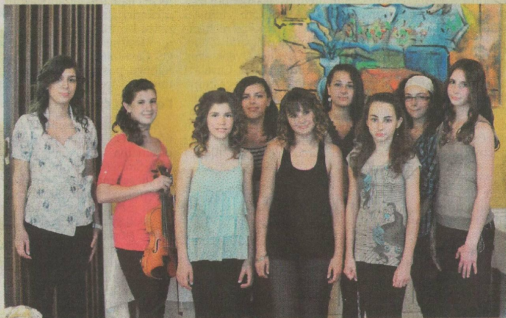
Vokalna skupina »No Name« iz OŠ »Rikard Katalinić Jeretov«

Jedan od prvih službenih nastupa ostvarila je vokalna skupina »No Name« iz OŠ »Rikard Katalinić Jeretov« koja aktivno djeluje od početka drugog polugodišta ove školske godine